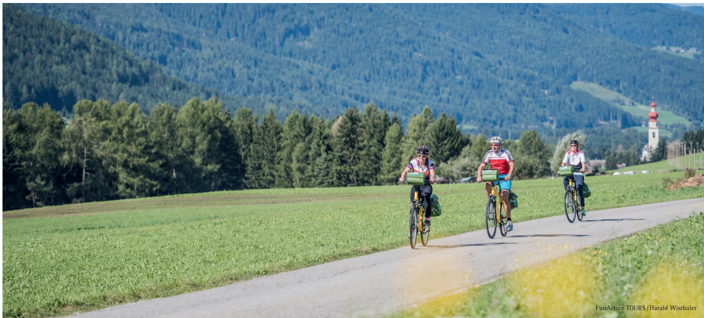
FunActive TOURS / Harald Wisthaler