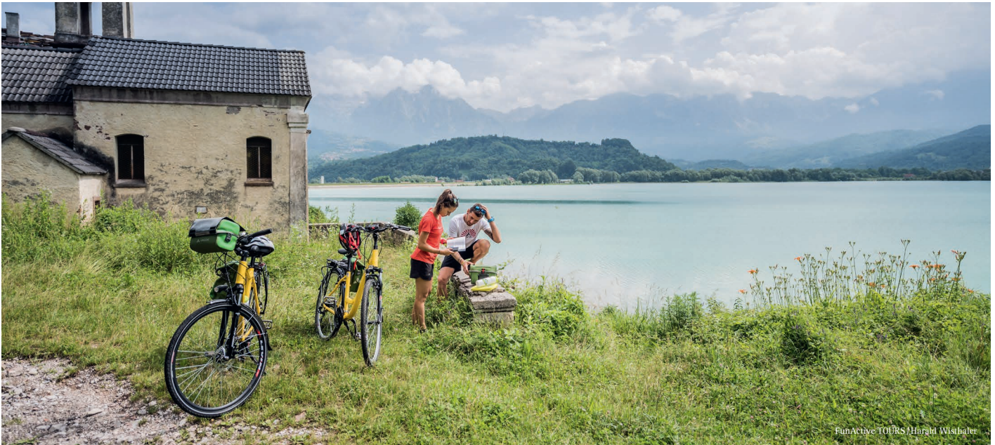
FunActive TOURS / Harald Wisthaler