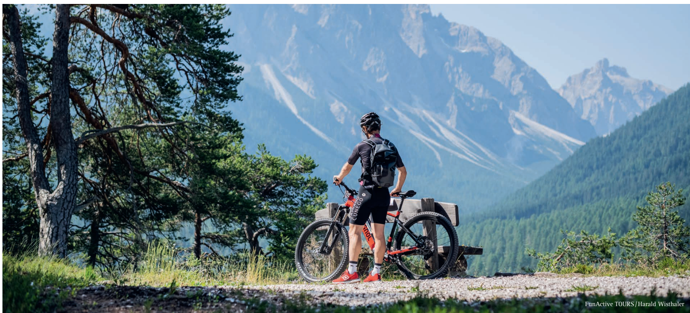
FunActive TOURS / Harald Wisthaler

Mit dem Mountainbike auf den Spuren des bekannten MTB-Rennens