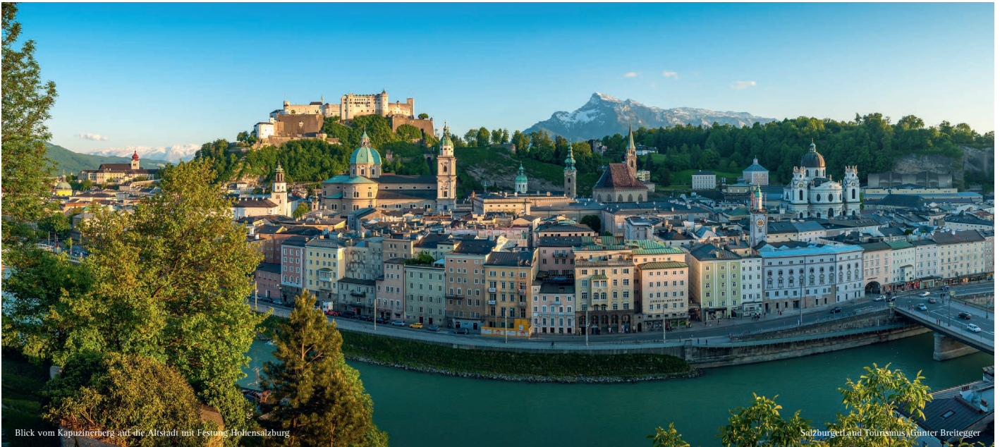
Blick vom Kapuzinerberg auf die Altstadt mit Festung Hohensalzburg