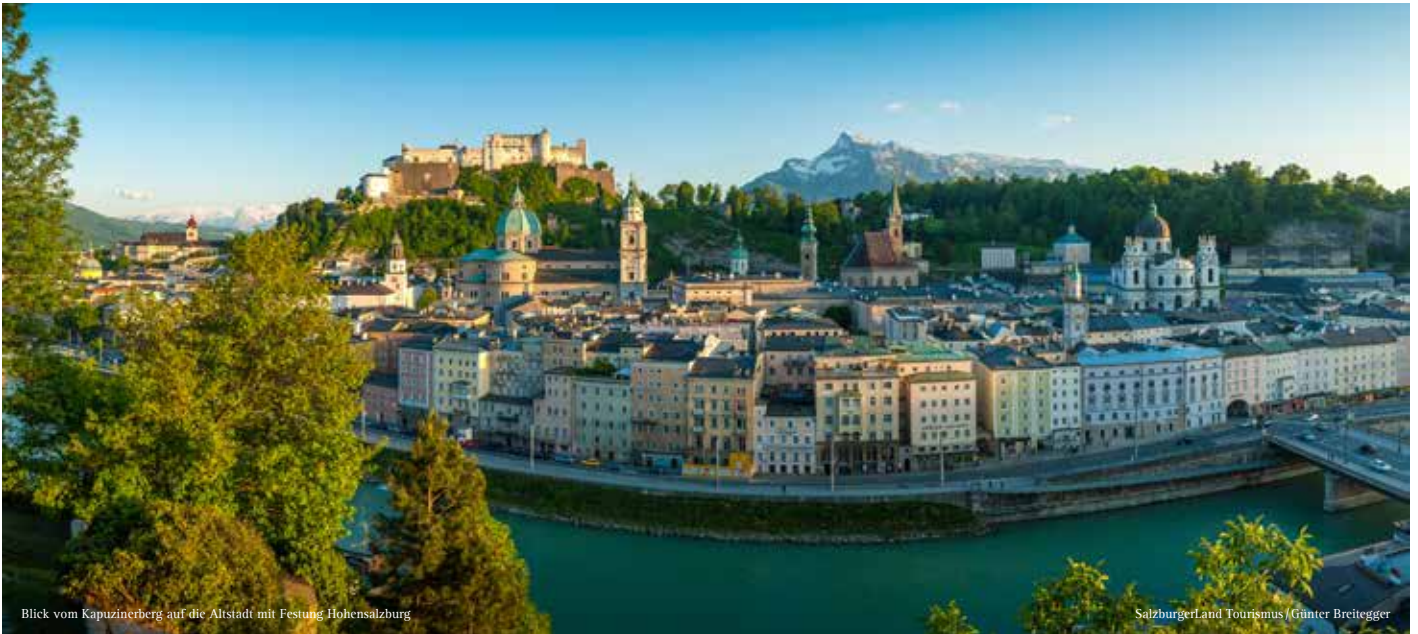
Blick vom Kapuzinerberg auf die Altstadt mit Festung Hohensalzburg